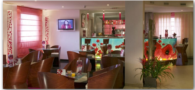
AVDA. SAN MARTÍN DE VALDEIGLESIAS, 4 / 28922 - ALCORCÓN

El ibis hotel en Alcorcón Tres Aguas está a 15 minutos del Centro de Madrid en transporte público. Igualmente, se encuentra a 7 km del Recinto Ferial de la Casa de Campo , el Zoo y el Parque de Atracciones.